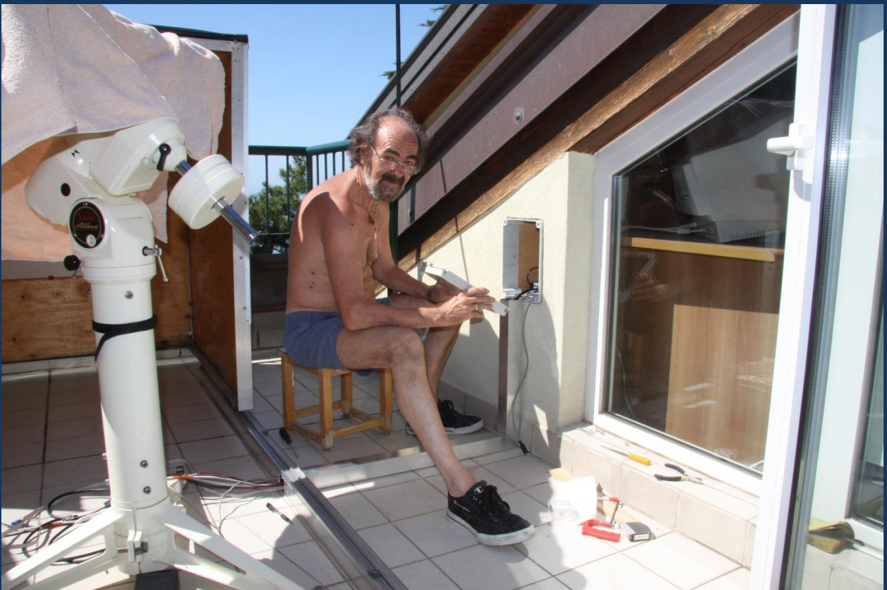
Finalmente il passaggio dei cavi diventa fisso.