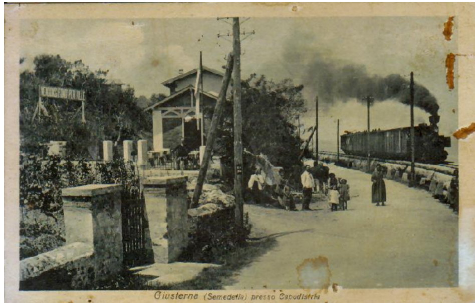
Giusterna (Semedelia) presso Capodistria

Ci conviene, ora, tornare indietro e proseguire il viaggio mnemonico lungo la strada litoranea, che consentiva corse spericolate in bicicletta o camminate salutari e distensive, comoda via di comunicazione per i non pochi studenti d'Isola che, frequentanti le magistrali "Sauro" e il ginnasio-liceo "Combi", la percorrevano regolarmente in bicicletta, con qualunque tempo, sole o pioggia, sfidando anche le feroci raffiche invernali della bora.